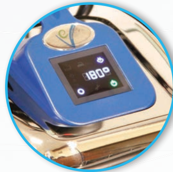
Touch Screen Display mit Zähler