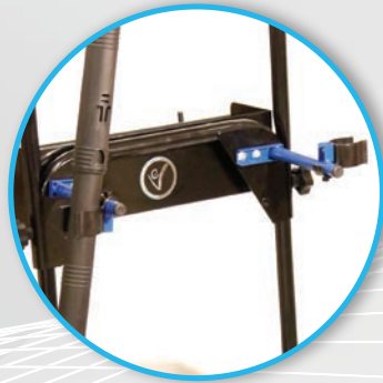
Zwei Halterungen für Zubehörteile