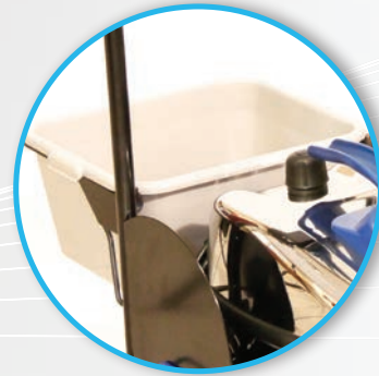
Korb für Zubehör und Tücher