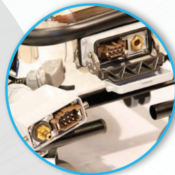
Sicherheitsstecker nach Industriestandard