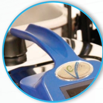
Industrie-Griff für separate Verwendung